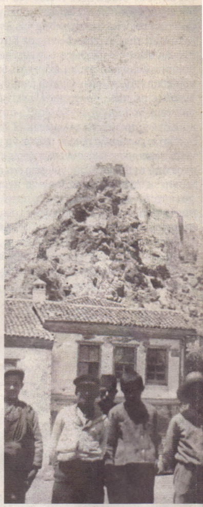
Φωτογραφία ταχύδρομημένη στις 5 Ιουλίου μπροστά στο τζαμί κάτω από το Κίστρο.

Ο δεύτερος τόμος φέρει τον τίτλο «Λήμνος, ιστορική και πολιτιστική